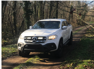
MERCEDES X-CLASS 2018+